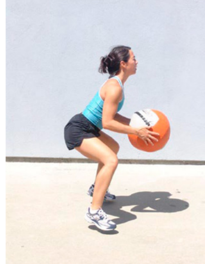
Sin extensión de cadera