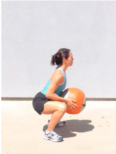
Codos bajos y lentos al recibir