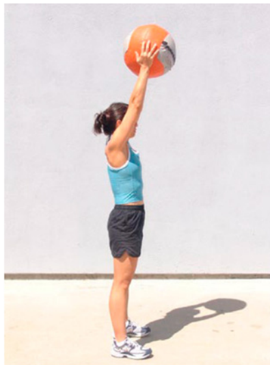
Brazos no rectos por encima de la cabeza