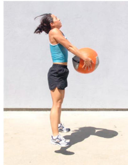
Correcciones: Brazos rectos, extensión completa, encogimiento de hombros, sin tirar demasiado alto, pelota cerca del cuerpo