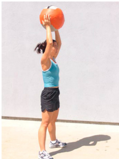
Brazos doblados por encima de la cabeza

Durante un calentamiento, hay innumerables oportunidades para corregir malas mecánicas. Tirar con los brazos, no completar la extensión de cadera, no encogerse de hombros, tirar demasiado alto, levantar los talones en el primer tirón, encorvar el balón, perder la extensión de la espalda, mirar hacia abajo, recibir alto y luego ponerse en cuclillas, bajar lentamente, codos lentos... todos los errores están ahí.