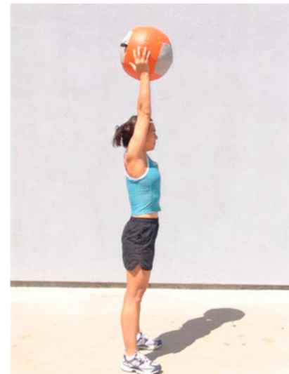
Posición correcta por encima de la cabeza