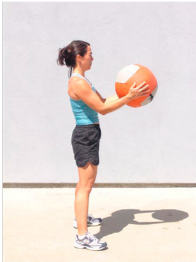
Curvando la pelota