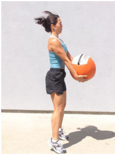
Sin encogimiento de hombros