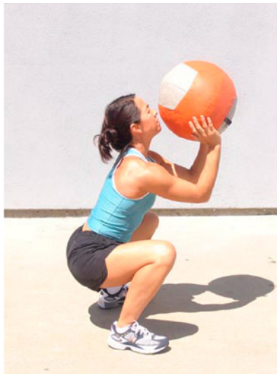
Corrección: Recibir con codos altos

Usamos la limpieza con balón medicinal en calentamientos y enfriamientos para reforzar el movimiento, y los resultados son evidentes en la cantidad y velocidad de récords personales que estamos viendo en las limpiezas con barra de todos nuestros atletas. ¡Sí, el beneficio se transfiere a la barra, incluso para nuestros mejores levantadores!