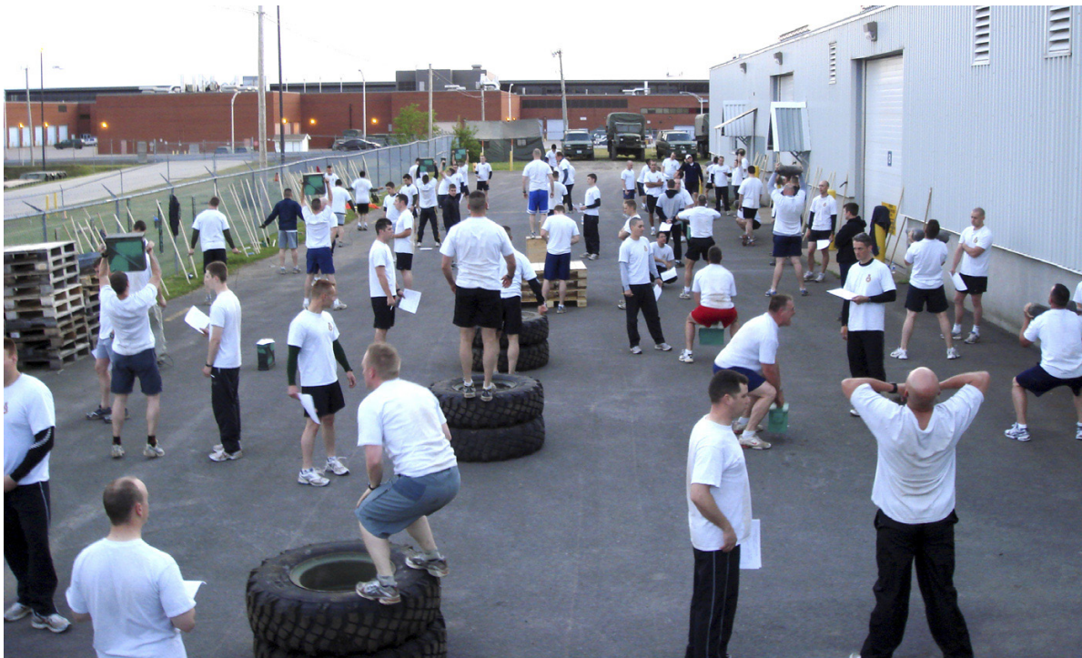
Una recente implementazione di "Palmer" con 80 persone