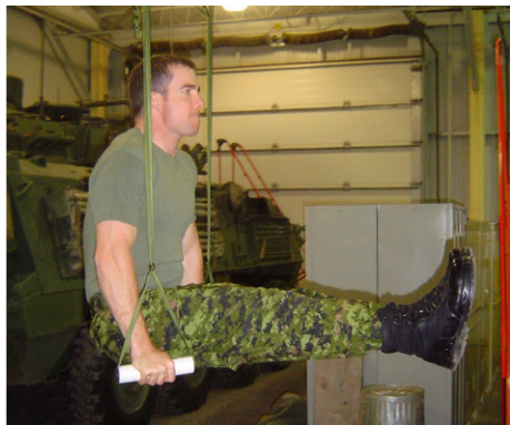
Ci-dessus : Le Dip Sautant